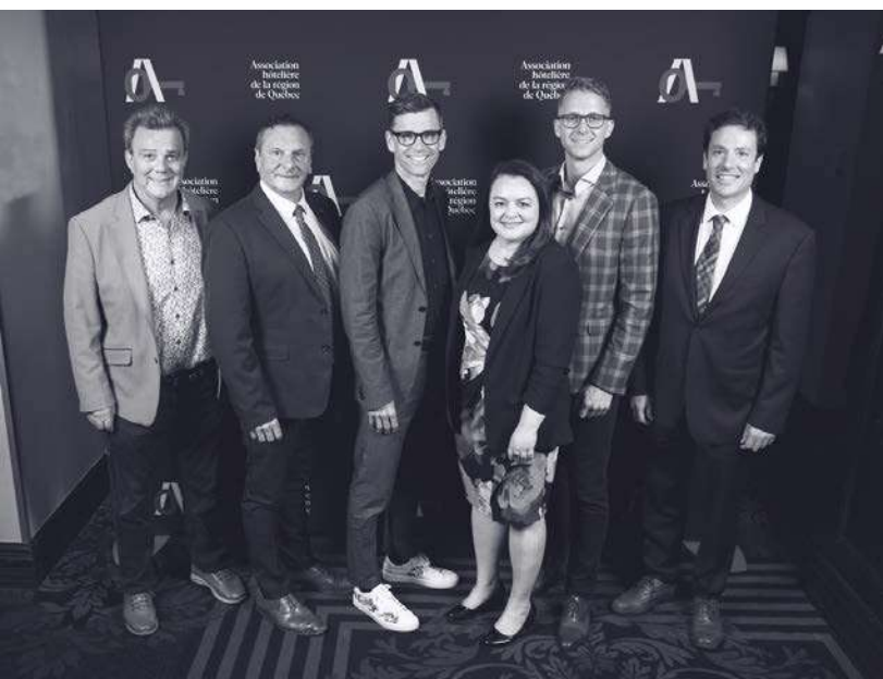
Photo prise lors de l'Assemblée générale annuelle de l'AHRQ le 6 juin 2023